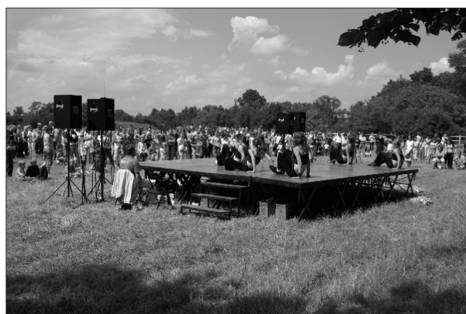
występy kapeli podwórkowej EKA z Ośrodka Kultury HUTNIK w Gostyniu.

Wyśmienitym przerywnikiem w trakcie zawodów były