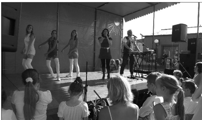
Gwiazdą wieczoru był zespół „Happy End”, którego repertuar obejmował do dziś znane i lubiane piosenki

sprzed lat, np. „Jak się masz, kochanie” czy „Dziś wielki bal”.