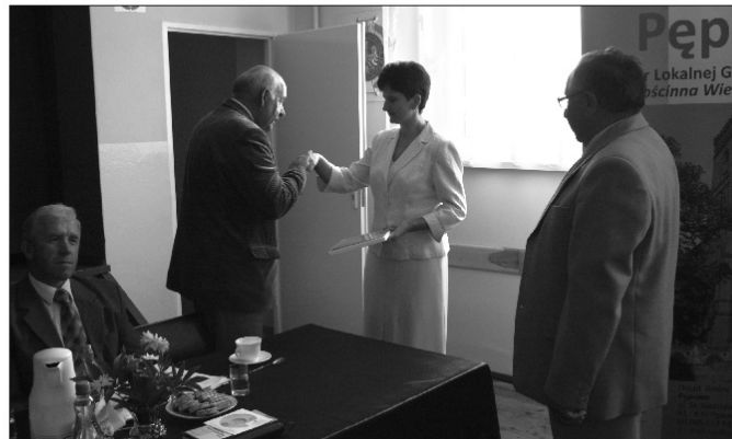
Wójt i Przewodniczący Rady Gminy wręczyli na ręce p. Sołtys wsi Gębice podziękowanie za dobrą pracę.